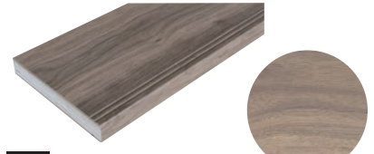
DJ ダークウォールナット

おおらかさと力強さが共存するナチュラルオーク。 あたたかみのあるテイストで落ち着きを感じさせる木目柄です。