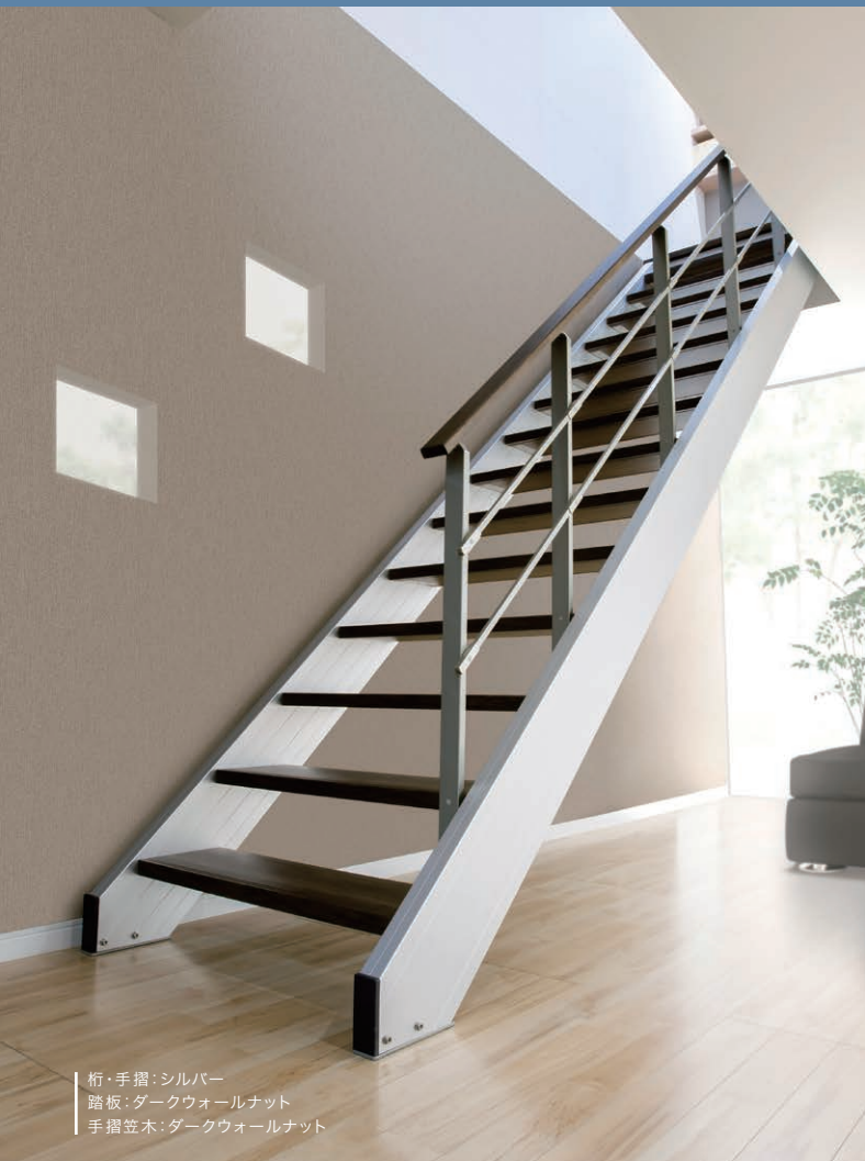
桁・手摺：シルバー 踏板：ダークウォールナット 手摺笠木：ダークウォールナット

上階とをつなぐ2本のシンプルアルミライン。 インテリア性が高まる、アルミ製オープン階段「アルフィール」デビュー。