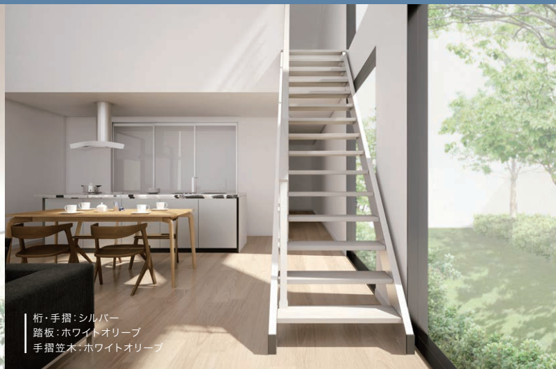
桁・手摺：シルバー 踏板：ホワイトオリーブ 手摺笠木：ホワイトオリーブ