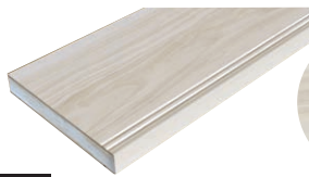
WO ホワイトオリーブ

EBは、大日本印刷株式会社の登録商標です。EB=電子線(Electron Beam)