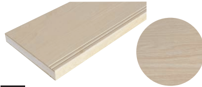
NO ナチュラルオーク

シルキーな素材感とリズミカルな目形の質感。 洗練されたシンプルでエレガントな木目柄です。