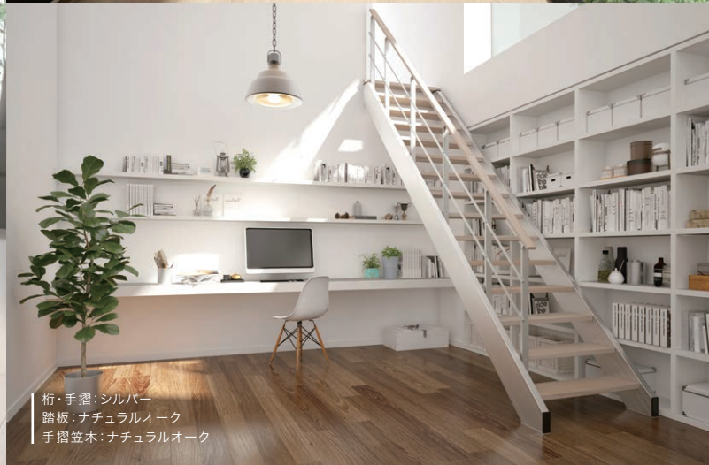
桁・手摺：シルバー 踏板：ナチュラルオーク 手摺笠木：ナチュラルオーク