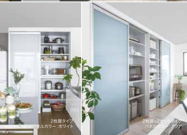
2枚扉タイプ パネルカラー：ホワイト