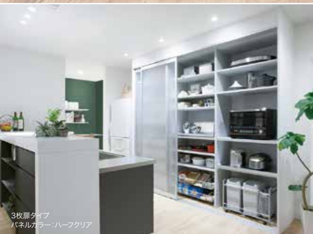
3枚扉タイプ パネルカラー：ハーフクリア

グレイッシュなカラーに一新し、上品さをプラス。 どんなキッチン空間にも美しくフィットする「ユニモ2」新登場です。