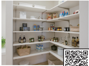
アームハンク棚柱SS