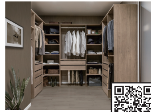
ウォールゼット ノエル3