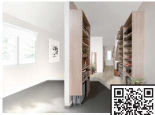
ウォールゼット エノーク2